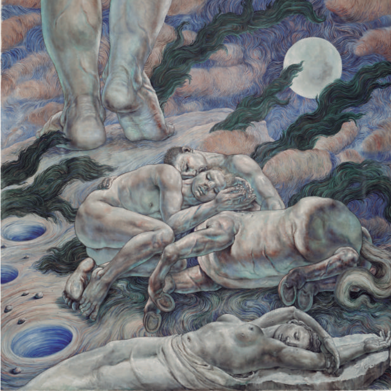
Nocturno IV , 2013, óleo sobre tela e inclusiones, 315 x 315 cm