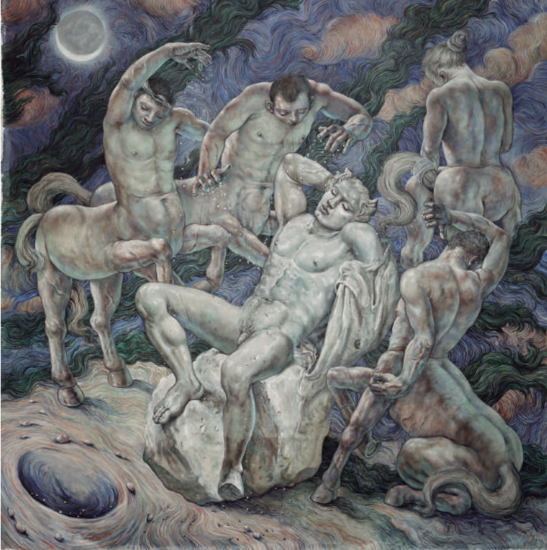
Nocturno II , 2013, óleo sobre tela e inclusiones, 315 x 315 cm