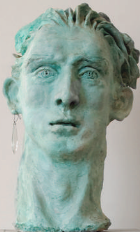
Cabeza 1 , 2013, cerámica y madera, 178 x 55 x 50 cm