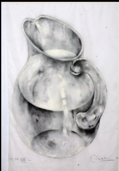
Págs. 26 y 27: sin título, 2013, carbonilla y guache sobre tela, voile y piedras brillantes, 200 x 140 cm