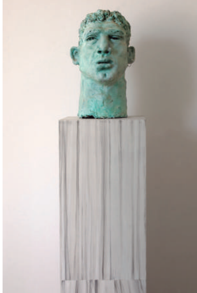
Cabeza 2 , 2013, cerámica y madera, 178 x 55 x 50 cm

• Arte Santander , Galería MITO, Santander