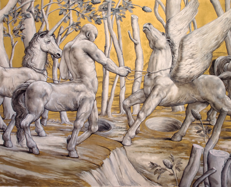
Pasaje , 2015, óleo sobre tela, 500 x 210 cm