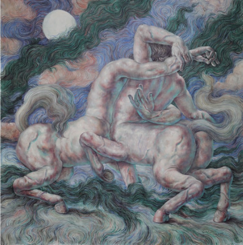
Nocturno I , 2013, óleo sobre tela e inclusiones, 315 x 315 cm