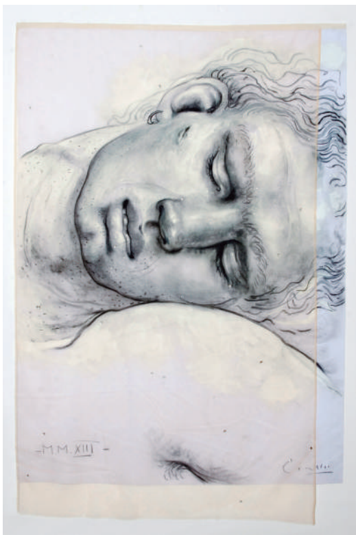
Págs. 6 y 7: sin título, 2013, carbonilla y guache sobre tela, voile y piedras brillantes, 200 x 140 cm