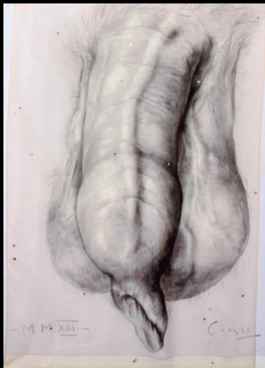
Págs. 20 y 21: sin título, 2013, carbonilla y guache sobre tela, voile y piedras brillantes, 200 x 140 cm