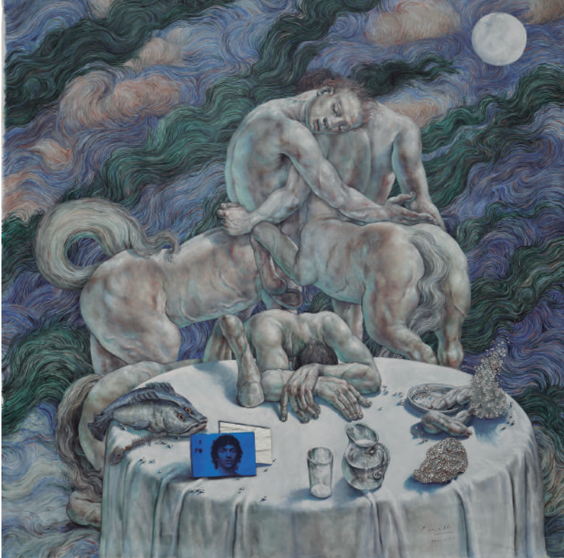
Nocturno III , 2013, óleo sobre tela e inclusiones, 315 x 315 cm